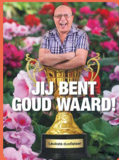
JIJ BENT GOUD WAARD!

Op vrijdag 13 en zaterdag 14 maart 2020 wordt de landelijke vrijwilligerscampagne NLdoet voor de 16e keer gehouden. NLdoet is een mooie gelegenheid om kennis te maken met een andere vrijwilligersclub. Een leuke manier om eens wat anders te doen met je collega's, vrijwilligers en deelnemers! Op www.nl doet.nl kun je alle informatie vinden